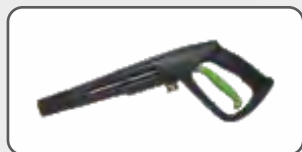
Pistolet z mosiężnym złączem S-98929

Czyści do 40% szybciej niż standardowa dysza. Silny obrotowy strumień skutecznie usuwa brud ze stałych, twardych powierzchni. Wkład dyszy wykonany z ceramiki oraz mosiężne złącza zapewniają jej długą żywotność i bezawaryjną pracę.