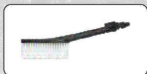
Szczotka Uniwersalna S-97922