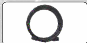
Wąż Wysokociśnieniowy w Oplocie Stalowym 10 m S-98939