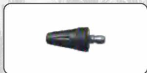
Dysza Turbo S-98935