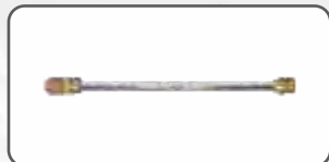
Lanca Stalowa S-98925