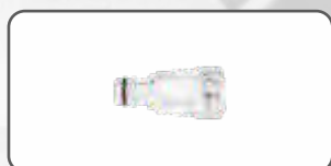
Filtr wody S-97930